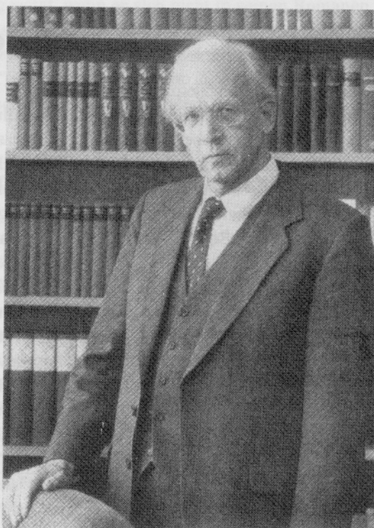
Prof. Dr. Ernst Nolte

"Jeder Überlebende hat mehr zu sagen, als alle Historiker zusammen, was geschehen war." 9)