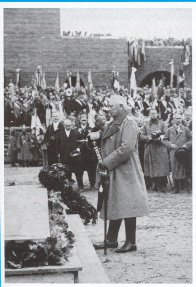
Reichspräsident Paul v. Hindenburg

Zwei ganz unterschiedliche Repräsentanten deutscher Politik